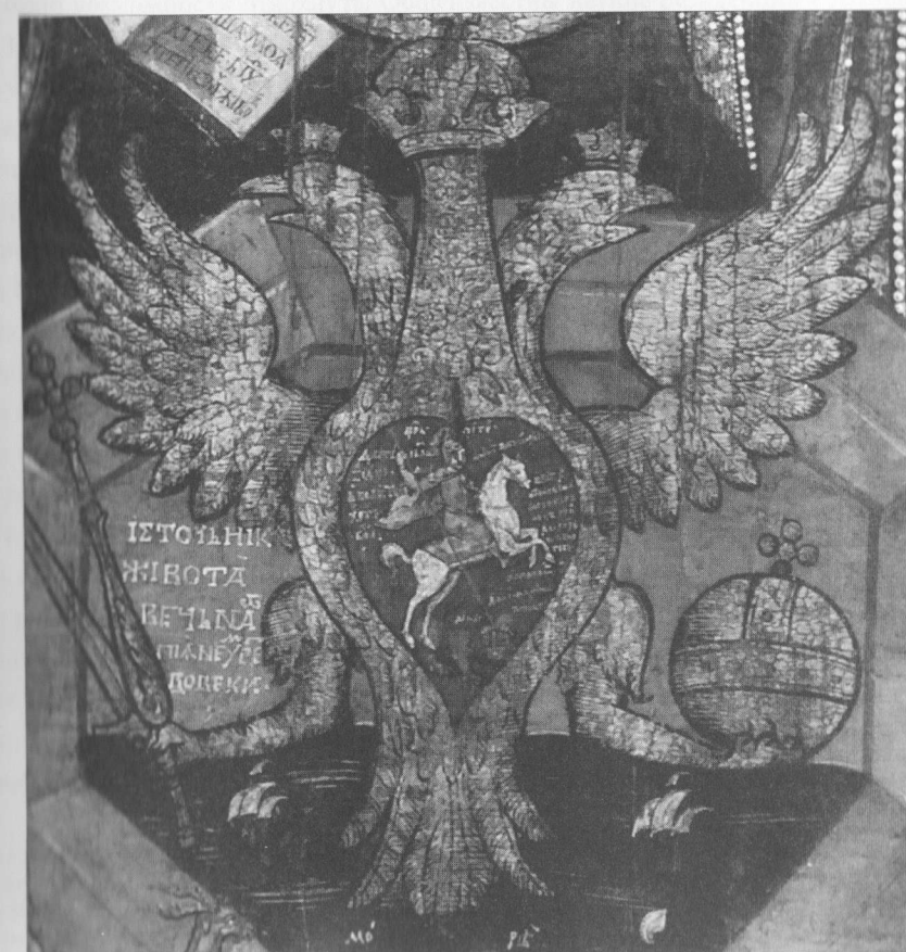
Икона "Литургия Господня" фрагмент