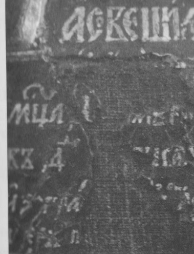
Икона "Литургия Господня" фрагмент