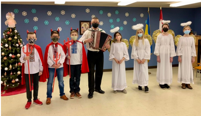
Ridna Shkola, Edmonton , AB