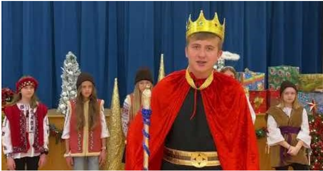
Ivan Franko School Of Ukrainian Studies, Edmonton, AB, online Celebration: https://bit.ly/3rKViuH