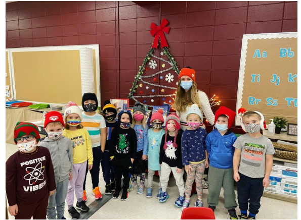
St. Martin Ukrainian Bilingual Elementary School, Edmonton, AB