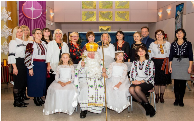
Ridna Shkola UNF Toronto West, Toronto, AB